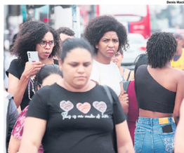
AUTODECLARAÇÃO. Pessoas negras são 40,5% do total na região