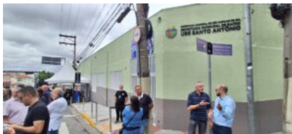
Unidade Básica de Saúde terá Farmácia também

“São 8.000 moradores nesse bairro, que tinham que se deslocar, ou para o Cerâmica, ou para a Fundação, para ter atenção básica, contudo, a agente quer, de fato, regionalizar bairro a bairro, estamos entregando esta aqui, como falei: a penúltima, é a entrega de um imóvel que adaptamos para unidade Básica de Saúde, mas, tenho certeza que o Tite vai pensar nisso de forma definitiva para o bairro Santo Antônio para os próximos quatro anos”, propôs Auricchio ao futuro prefeito, Tite Campanella – PL.