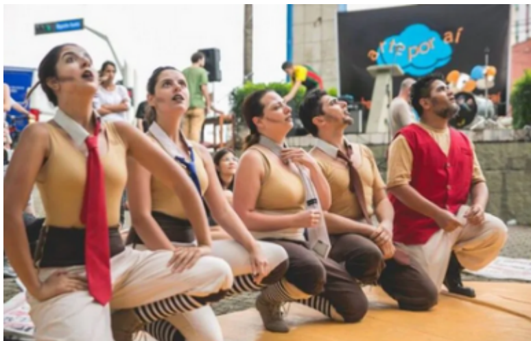
Projeto arte por aí