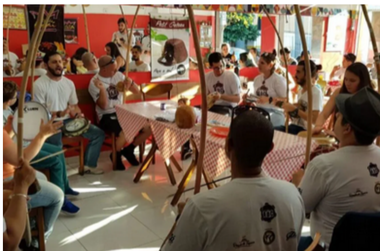
Amigos da Capoeira (Divulgação)

A Secult enviará à Secretaria de Cidadania e Diversidade Cultural do Ministério da Cultura, após a fase de Habilitação, a relação dos Pontos de Cultura aprovados por meio Edital nº 20/2024 – Secult, para que constem na base de dados do Cadastro Nacional de Pontos e Pontões de Cultura.