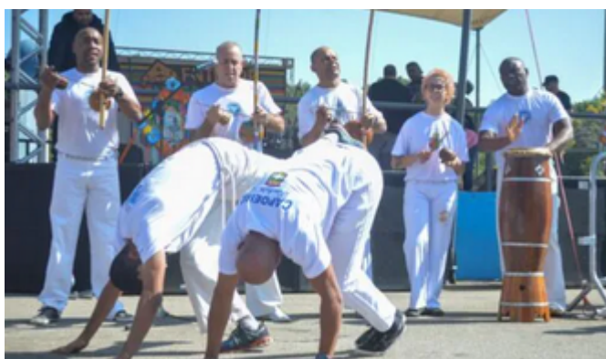
Capoeira Santa Izabel

Com inscrições gratuitas até 20 de novembro, incentivos podem chegar até R$ 30 mil