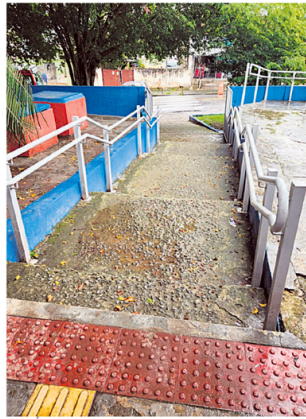
MAUÁ. Britas aparentes no piso representam risco de quedas

Em nota, a Prefeitura de Mauá apontou que tem realizado uma série de obras em UBSs desde 2021 e afirmou que, na unidade citada, as intervenções incluíam renovação da unidade, o que incluiu pinturas e portas, além do conserto do elevador e nivelamento do piso da área externa, facilitando acesso ao estacionamento. "Novas intervenções estão dentro da programação