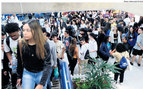
PROVAS. Portões estarão abertos das 12h às 13h (horário de Brasília), quando se fecham pontualmente

As provas serão aplicadas em dois dias distintos, com conteúdos específicos em cada um deles. Amanhã, os estudantes farão as provas de linguagens, códigos e suas tecnologias, redação e ciências humanas, totalizando cinco horas e 30 minutos de duração. No segundo dia, em 12 de novembro, será a vez de ciências