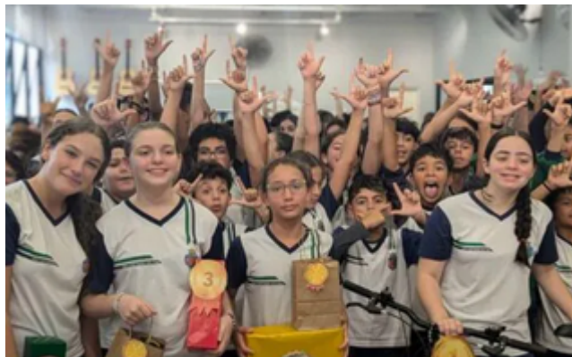
Desafio da Tabuada

As vencedoras ganharam prêmios doados à escola: uma bicicleta pelo primeiro lugar, um jogo Genius pelo segundo e jogos de estratégia para o terceiro e quarto lugares