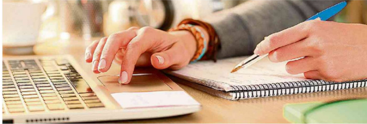
No ano passado, segundo o Censo do Ensino Superior, do Inep, 343.209 pessoas estudavam de forma remota no Rio Grande do Sul

Percentual de alunos matriculados em educação a distância no RS chega a 58,35%, o segundo maior entre as unidades da federação. Especialista aponta correlação entre redução de oferta de financiamento e diminuição do modo presencial