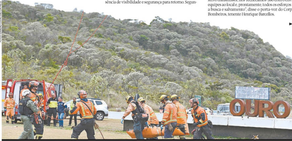
BOMBEIROS CARREGAM CORPO DE UMA DAS VÍTIMAS: BUSCAS COMEÇARAM AINDA NA SEXTA E OPERAÇÃO DUROU ATÉ A TARDE DE ONTEM