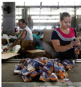
Funcionárias trabalham na fábrica da Brinquedos Gulliver, em São Caetano do Sul (SP); empresa tem só 50 empregados

De lá para cá, outros fatores afetaram o desempenho da empresa: a pandemia, a importação direta de brinquedos da China, as fábricas de brinquedos baratos e de baixa qualidade no Brasil e a disseminação dos jogos eletrônicos, que tomaram o espaço dos