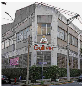
Fachada da fábrica da Brinquedos Gulliver, em São Caetano do Sul (SP), que está em leilão para pagamento de dívidas

brinquedos físicos na preferência das crianças.