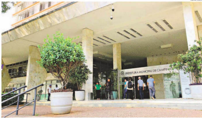
Visita da Prefeitura de Campinas, centro das atenções em meio às pesquisas eleitorais que destacam as tendências e preferências dos eleitores