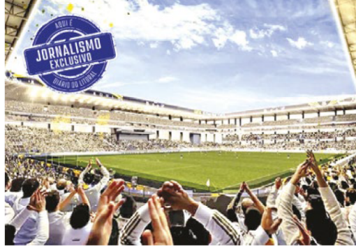
A expectativa é que o novo estádio da Vila Belmiro tenha capacidade para 30 mil espectadores