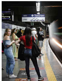
Passageiros aguardam na estação Vila Mariana.