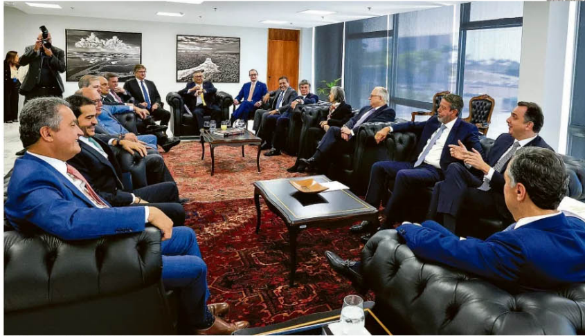
Tentativa de entendimento. A cúpula do Congresso, do Supremo e ministros do governo Lula se reuniram por três horas para discutir regras para as emendas parlamentares ao Orçamento da União

O cálculo feito pela Casa Civil é que, agora, os R$ 15,7 bilhões de emendas de comissão terão algum tipo de