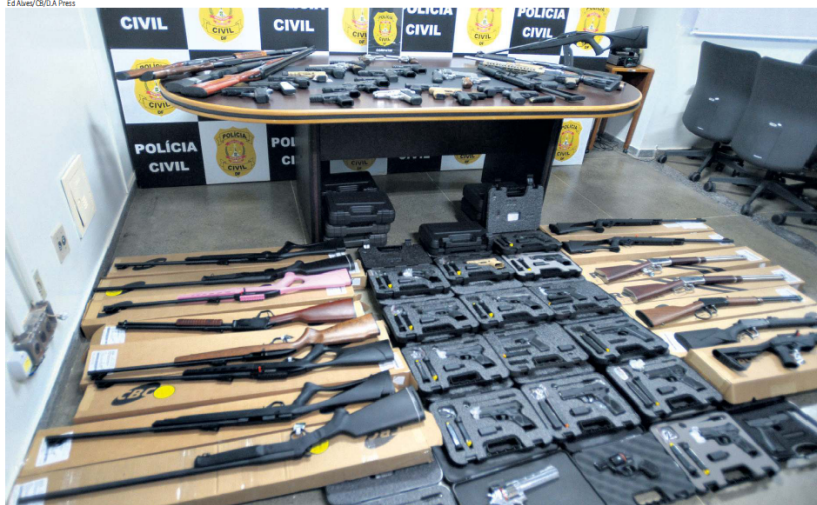
De acordo com a polícia, armamentos apreendidos na loja, na casa e no clube de tiro não são os furtados, mas o objetivo é evitar uma possível venda ilegal