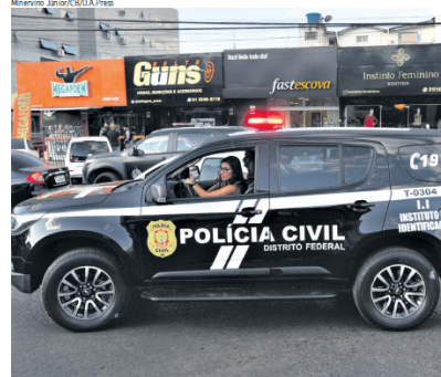
Para evitar a fuga dos envolvidos, operação foi sigilosa e durou mais de um mês

no presídio de Palmas colocou em cheque a veracidade da denúncia. "A principal hipótese é de que o comunicante (dono da Delta) utilizou dessa subtração para justificar o desaparecimento de 76 armas", frisou o delegado.