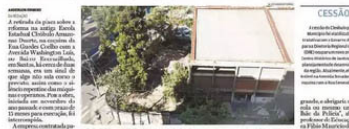
Trabalhos no prédio têm prazo de execução de 15 meses a partir da emissão da ordem de serviço

Empresa contratada para reformar o prédio alegou problemas financeiros; 2ª colocada na licitação vai assumir