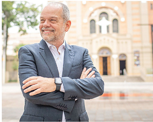
Tite teve um crescimento de 17,3% de pontos percentuais em comparação à pesquisa realizada no mês de março (Registro TSE - 01419/2024), quando ele tinha 27,7%.