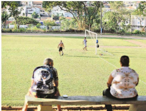
A tradicional Praça de Esportes Argemiro Roque, localizada no bairro São Bernardo, foi reformada graças aos recursos financeiros provenientes de emendas de deputados federais e estaduais

Montante foi enviado para obras no município no período de três anos e meio