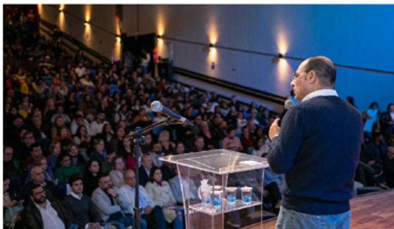
O investimento da Gestão Auricchio supera em muito o mínimo constitucional exigido

Ao longo dos últimos oito anos, a Prefeitura de São Caetano tem reafirmado seu compromisso com a saúde pública, dobrando significativamente os investimentos no setor. Em outras palavras, o mon-