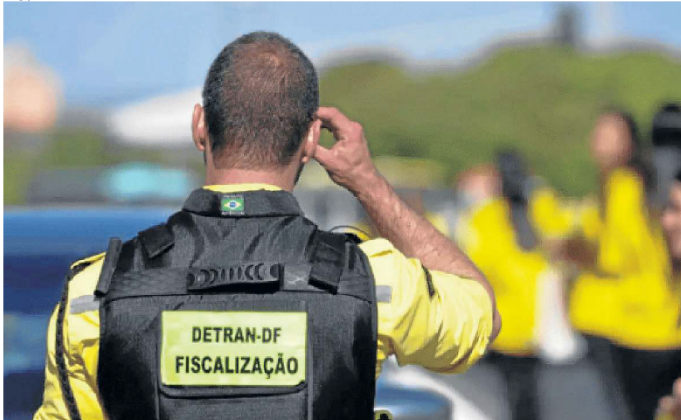
Em 2023, no DF, foram mais de 25 mil flagrantes de condutores que dirigiram depois de beber