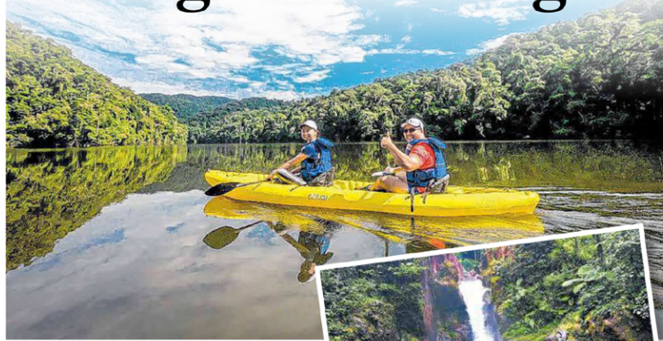
Destino tem esportes radicais, cachoeiras, cavernas e muita natureza para ser apreciada