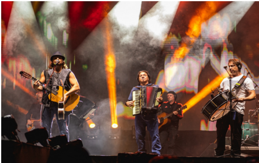
Terceiro dia Entoada Nordestina (26/05) com grupo Falamansa

A 13ª Entoada Nordestina de São Caetano do Sul foi encerrada neste domingo (26/05) com a marca de mais de quatro toneladas de alimentos arrecadados para as vítimas das enchentes ocorridas no Rio Grande do Sul. Nos três dias de festa, no Espaço Verde Chico Mendes, um público de mais de 50 mil pessoas rebateu o frio e a chuva com a alegria da música e o vigor da culinária nordestina.