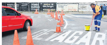
STO. ANDRÉ. Maio Amarelo vai além de atividades educativas, com reforço na sinalização e conscientização

Em Diadema, hoje, ocorrerá uma intervenção artística chamada Travessia Segura no Largo de Piraporinha, das 9h às 11h e das 13h30 às 15h30. Na cidade de Ribeirão Pires, o foco será nas unidades escolares. No dia 28 de maio, estudantes apresentaram uma mostra de trânsito e mobilidade na Escola Estadual Mario Alexandre Fato Neri. Durante o mês, a Prefeitura também está com uma ação voltada ao trânsito, a Operação Visibilidade. RS