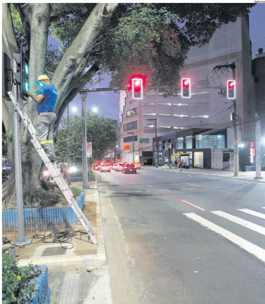
MAOS A OBRA. Funcionários da Newstec já iniciaram a substituição dos semáforos em trecho da Goiás, na região central