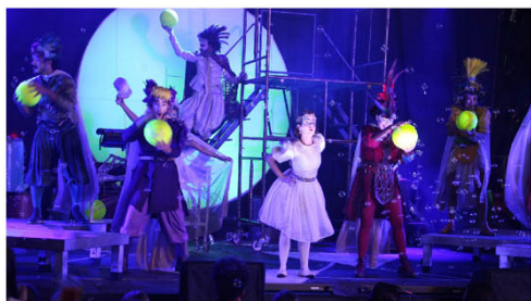
A iniciativa é da rede Sesc São Paulo em parceria com a Prefeitura de São Caetano, por meio da Secult - Secretaria Municipal de Cultura