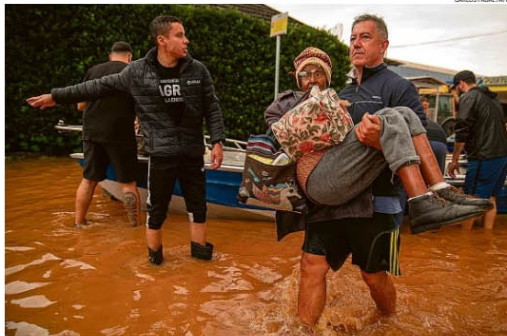
Alerta de "inundação severa". Idosa é resgatada em Porto Alegre, que teve áreas alagadas com a cheia do Rio Guaíba