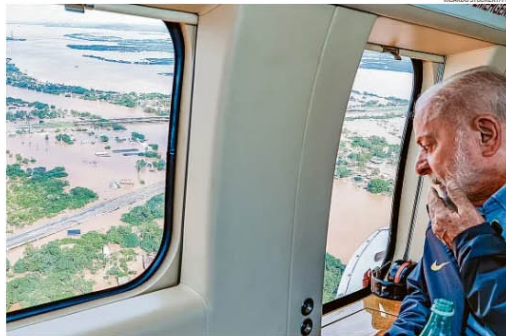
Sobrevivo. Lula voltou ao Rio Grande do Sul ontem, cobrou Marina e prometeu ajudar a recuperar estradas estaduais