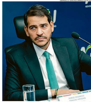
Aumento. Advogado-geral da União, Jorge Messias: recorde de ações em 2023

Apesar de ter sido Bolsonaro o principal questionador do Congresso na Corte, os presidentes da Câmara e do Senado, Arthur Lira (PP-AL) e Rodrigo Pacheco (PSD-MG), reagiram de forma enfática ao movimento recente da AGU de Lula no caso da desoneração, dado que a prorrogação da medida econômica havia sido aprovada no Legislativo. A insatisfação engrossa um caldo de atritos que não é de hoje e abarca ainda outras formas de