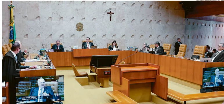
Judicialização. Plenário do STF: no governo Bolsonaro cresceu o número de ações impetradas no tribunal pela Advocacia-Geral da União, e a tendência ganhou força com o presidente Lula

— Tem uma atuação forte da AGU no Supremo para dizer que é competência da União — afirma Machado. O chamado controle concentrado de constitucionalidade