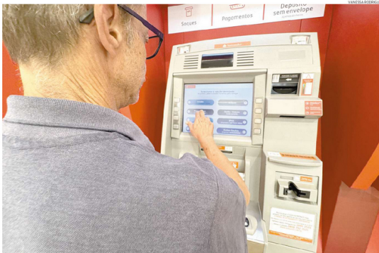
Apostados e pensionistas da Previdência receberam a primeira parcela do abono junto com o salário do mês, seguindo o calendário do INSS

"Para isso, muitas lojas já começaram a preparar suas novidades, investir em mais divulgação, para chamar os clientes e lidar