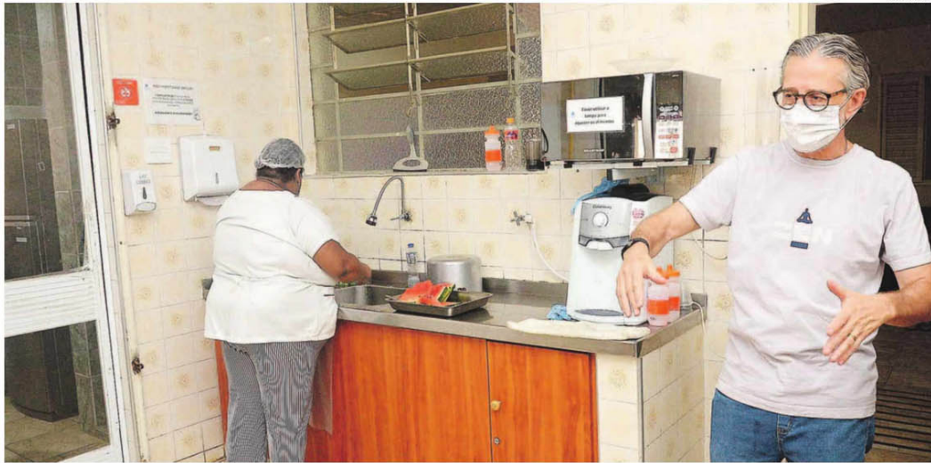
Edital lançado em 2021 contemplou 12 propostas na RMC em 11 cidades, entre elas a única que não envolve uma prefeitura: Lar São Vicente de Paulo, na Vila Industrial, recebeu R$ 600 mil, verba que contribuiu para que a entidade fizesse reformas na cozinha, banheiros e área externa

Edimarcio Augusto Monteiro edimarcio.augusto@rac.com.br