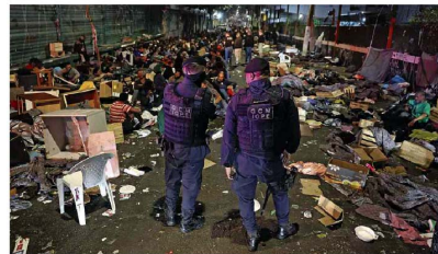
Agentes da Polícia Civil fazem operação para prender traficantes na crechezinha, centro de SP

Veículo: Impresso -> Jornal -> Jornal Folha de S. Paulo