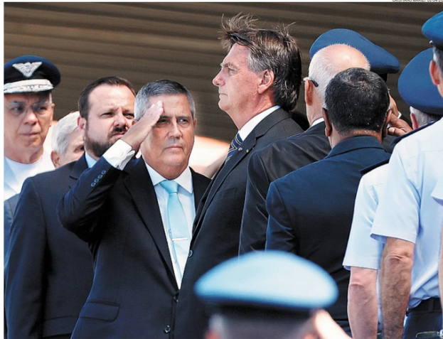
Peça-chave. Ex-ministro da Defesa, Braga Netto é apontado pela Polícia Federal como central na trama golpista no entorno do então presidente Jair Bolsonaro

Na lista de generais de alta patente sob suspeita está ainda Paulo Sérgio Nogueira, que