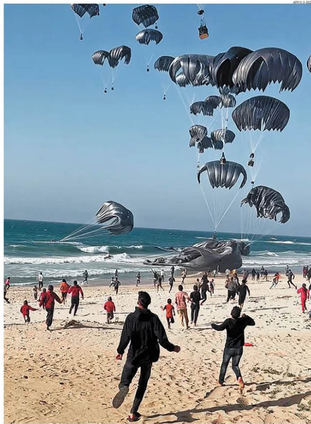
Fome e desespero. Palestinos correm em direção a pacotes de comida lançados pelo ar por aviões dos EUA em Gaza: desastre humanitário

O novo porto marítimo, quando concluído, constituirá uma rota adicional para a ajuda humanitária, que está