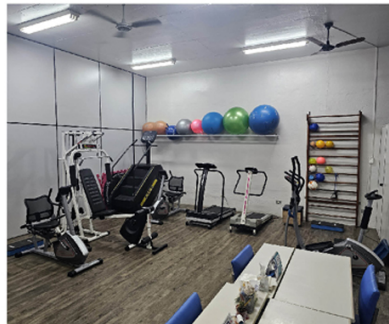
A APAE é referência na área, possuindo uma estrutura completa para atendimento de diversos casos