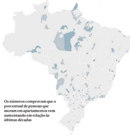
Vila ou condomínio

Os números comprovam que o percentual de pessoas que moram em apartamentos vem aumentando em relação às últimas décadas