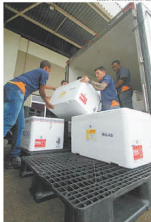
A SECRETARIA DE SAÚDE RECEBEU 78.790 DOSES DA DENGUE, ENTREGUES AINDA ONTEM AOS MUNICÍPIOS DAS REGIONAIS DE SAÚDE DE BH E CORONEL FABRICIANO

No total, Belo Horizonte tem 28 mil casos prováveis, de acordo com o balanço da SES. Itabira, na Região Central, vem na sequência, com 9.962 notificações - e a única entre os cinco municípios com mais