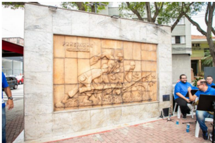
Praça dos Expedicionários Bandeira

A Praça dos Expedicionários foi entregue revitalizada pela Prefeitura de São Caetano no último sábado (17/02). O local, na Avenida Goiás com a Rua Alegre, recebeu a bandeira da cidade, que pode ser vista no alto do mastro de 25 metros.