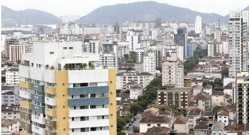
Limite mensal de renda é de seis salários mínimos (R$ 8.472,00). Quem já tem abatimento no IPTU não precisa pedir novamente. Objetivo é atender mais aposentados e pensionistas

Os interessados não podem ter pendências com a Prefeitura. Devem agendar atendimento no Poupatempo (Rua João Pessoa, 246) pelo site www.poupatempo.sp.gov.br , com cópias destes documentos: último comprovante de rendimento mensal; caso o cônjuge ou companheiro, se houver, não receba benefício previdenciário, deverá apresentar declaração de benefícios emitida pelo INSS; última declaração do Imposto de Renda; título de propriedade do imóvel e conta de luz emitida há menos de dois meses.