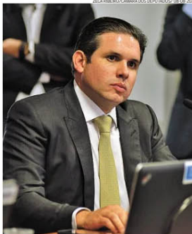
Motta. Indicação de recursos por comissão que nem faz parte

DIMITRIUS DANTAS E PATRIK CAMPOREZ REPORTAGEM