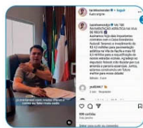
O prefeito de Jussara (BA), Tacinho Mendes, agradece ao deputado federal João Bacelar (PL-BA) pelos recursos enviados para a cidade