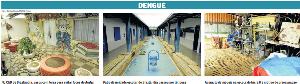
No CED de Brazlândia, vasos com terra para evitar focos de Aedes