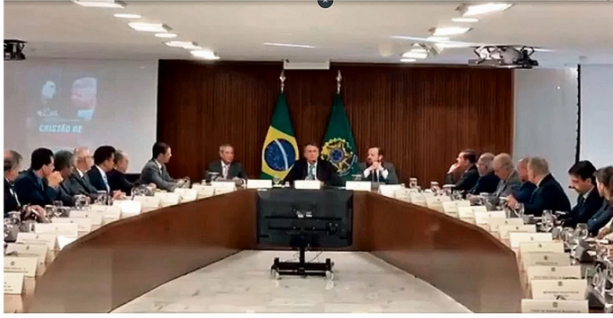
Documentado. Imagens de reunião de Bolsonaro com ministros, em julho de 2022, são citadas pela PF como indício da existência de uma "dinâmica golpista"

Bolsonaro está proibido de deixar o país e entregou seu passaporte à PF, segundo seu advogado, Fábio Wajngarten.