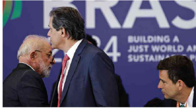
Lula, Fernando Haddad (Fazenda) e o presidente do BC, Roberto Campos Neto