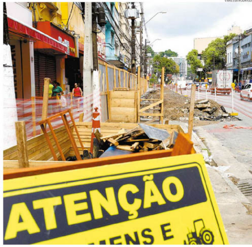
Trecho da Rua João Pessoa, no Centro, também está com interdição parcial para a realização dos serviços

possível deterioração por conta da ação do tempo, a EMTU garante que não existe esse risco. "O projeto do VLT prevê manutenções periódicas e a possibilidade de substituição do material degradado, caso seja necessário", pontua a companhia.