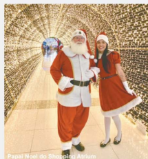
Papai Noel do Shopping Atium

O clima natalino tomou conta das ruas e shoppings da ABC. Papais-noéis, árvores de Natal, decorações iluminadas e espaços públicos com atrações especiais. É tempo de celebrar.