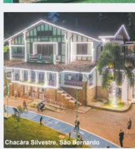
Chácara Silvestre, São Bernardo