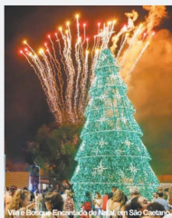
Vila de Natal Encantado de Natal em São Caetano