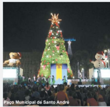
Paço Municipal de Santo André