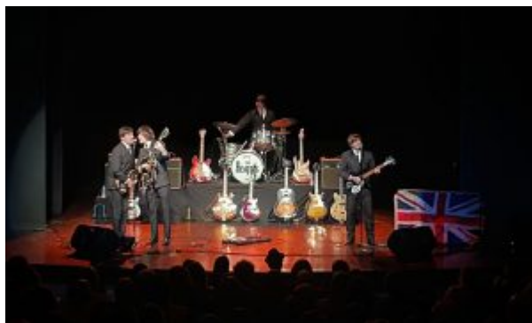
5 – Natal Solidário 2023 – Foto – Eduardo Merlino_PSA (17)

Na sexta-feira, às 20h, o palco da estrutura montada ao lado do espelho d'água do Paço Municipal reunirá fãs da banda britânica mais famosa de todos os tempos em uma Beatles Night, com apresentações dos grupos Beatles 4Ever e Beatles 4Ever Cartoon. Já no sábado, a partir das 19h, quem vai animar o público será a banda Coldplayers, com um cover do grupo Coldplay, em noite que haverá uma grandiosa despedida ao Papai Noel.