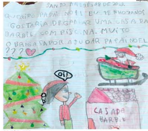
PRESENTE. Menina de 7 anos, de Sto. André, pediu a casa da Barbie