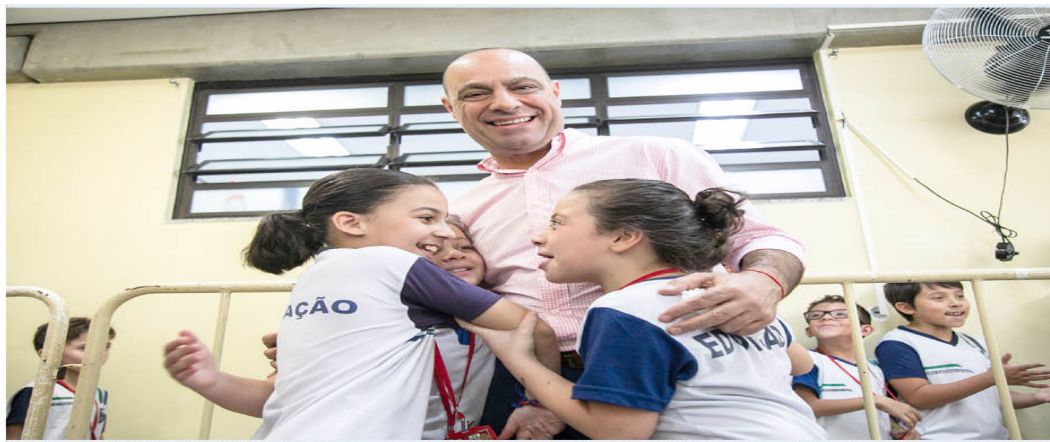
Atualmente, São Caetano tem oito escolas de Ensino Fundamental em período integral. As 12 escolas restantes aguardam a ampliação da carga horária a partir de dois modelos possíveis: 7h diárias (das 7h às 14h) ou 35h divididas na semana, sendo um dia todo na escola