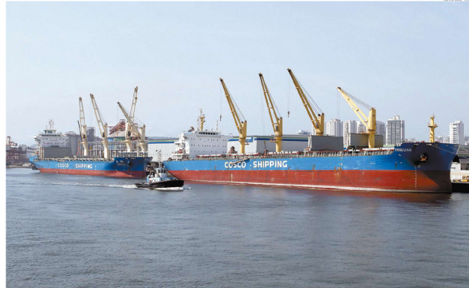
Túnel pelo mar tem previsão de custo de R$ 6 bilhões. Autoridade Portuária de Santos colocaria R$ 3 bilhões e o Governo do Estado entraria com a outra metade do valor

O presidente disse que marcará uma reunião, na próxima quarta-feira, entre representantes APS com os do Governo do Estado, da Prefeitura de Santos e de órgãos de trânsito para apresentar um cronograma