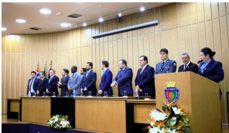
Câmara Municipal de São Caetano do Sul

realizou na noite de quinta-feira (26/10),