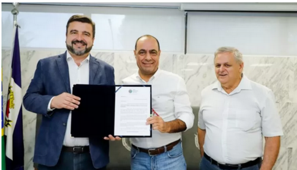
Projeto de Lei Cartao Gas e Mercado-18