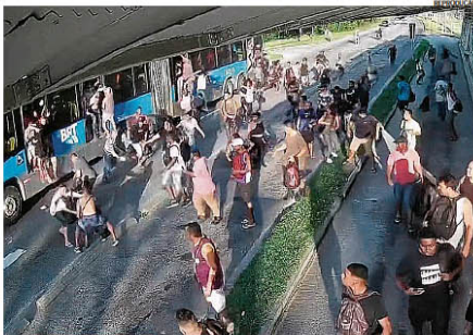
Nem o trem se salvou.

Composição da Supervia foi incendiada perto das 18h de ontem