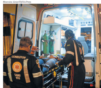
Feridos foram levados pelos socorristas a três hospitais públicos

O ônibus foi parado em um posto da Polícia Rodoviária Federal (PRF), onde agentes da ANTT constataram a irregularidade do veículo. Como procedimento padrão neste tipo de flagrante, o veículo é escoltado até o terminal rodoviário mais próximo para que os passageiros